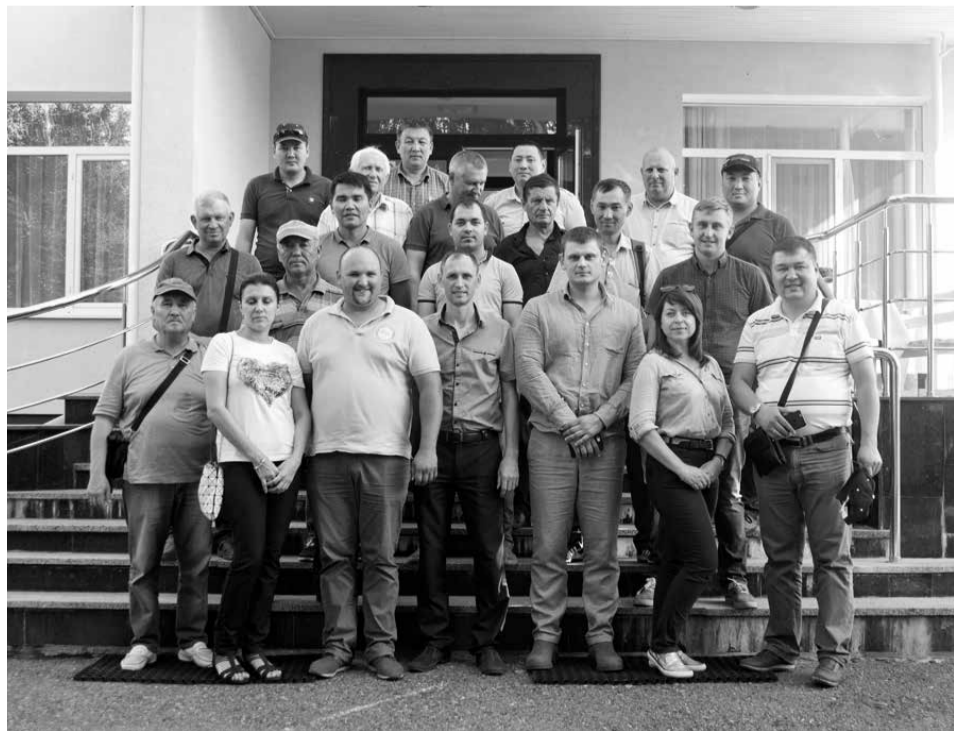
З казахськими гостями біля Центру органічного землеробства